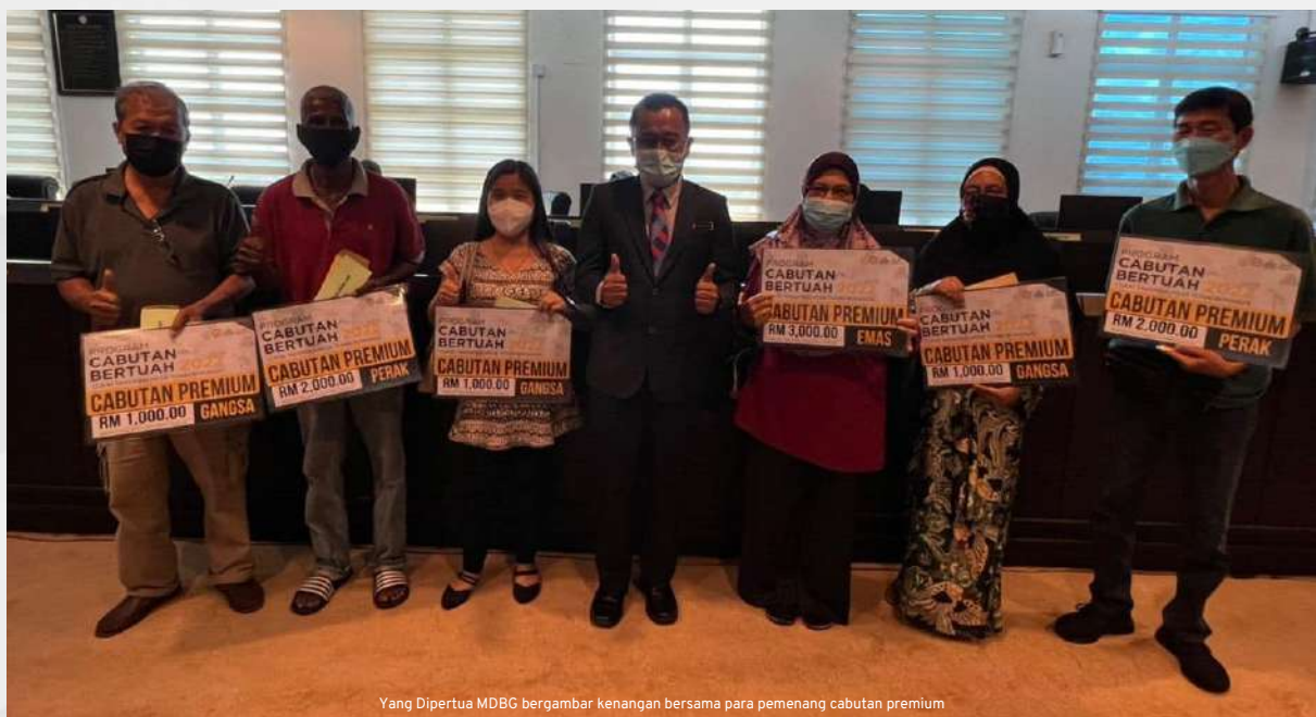
Yang Dipertua MDBG bergambar kenangan bersama para pemenang cabutan premium