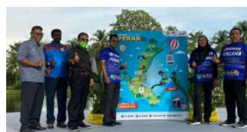
MAJLIS PERASMIAN DAN PELANCARAN FUN MAP BATU GAJAH DI THE TREASURE @TAMAN HERBA GOPENG

Majlis ini dilaksanakan secara hybrid dengan kehadiran penerima anugerah di Dewan Bandaran Kinta serta penonton diselaraskan di Auditorium, Majlis Daerah Batu Gajah atas nasihat Majlis Keselamatan Negara (MKN) dalam mengurangkan risiko penularan wabak Covid-19.