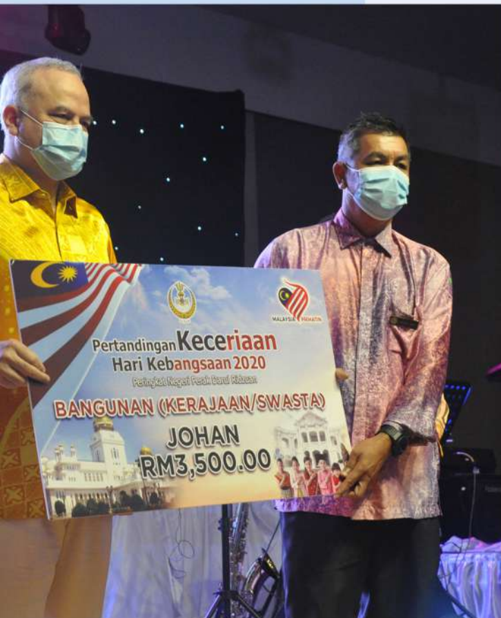
daripada baginda Tuanku.