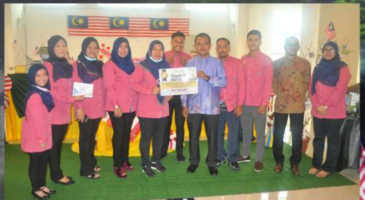
Tempat Ke-3 : Zon Neptun (Jabatan Penilaian dan Pengurusan Harta)