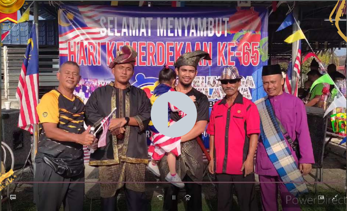
KAWASAN RUKUN TETANGGA (KRT), TAMAN TASEK PUTRA