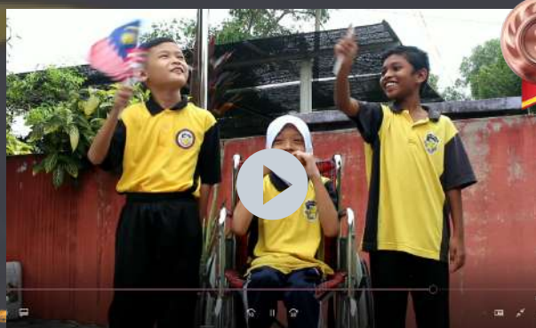
SEKOLAH KEBANGSAAN SULTAN YUSSUF

PERTANDINGAN VIDEO KREATIF SEMPENA SAMBUTAN HARI KEBANGSAAN TAHUN 2022