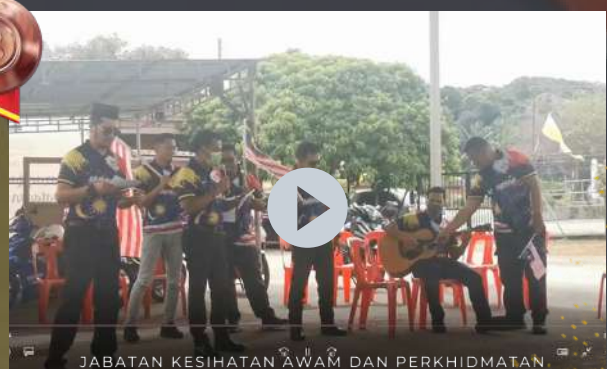
JABATAN KESIHATAN AWAM DAN PERKHIDMATAN PERBANDARAN, MAJLIS DAERAH BATU GAJAH